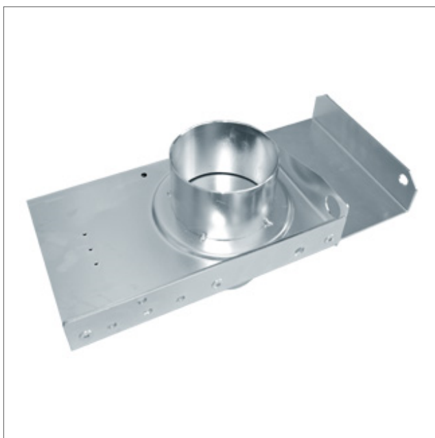
ADWP - Manual

Zasuwa ręczna szczelna z krawędzią prostą. Mikrowyłącznik może być montowany do średnicy 180mm. Sensory mogą być stosowane dla każdej średnicy.