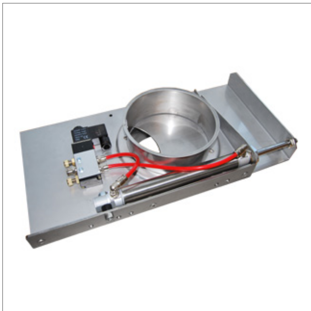
AUDS - Sliding damper pneumatic stainless AISI 304

Zasuwa pneumatyczna z krawędzią prostą, stal nierdzewna AISI304. Stal nierdzewna odporna na kwasy AISI316 może być dostarczona na zapytanie. Mikrowyłącznik może być montowany do średnicy 180mm. Sensory mogą być stosowane dla każdej średnicy.