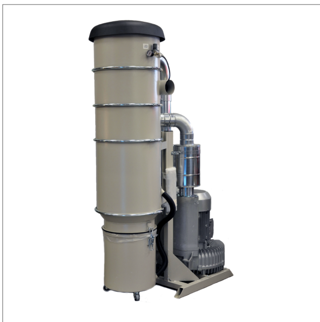
CE-13 - Suction unit