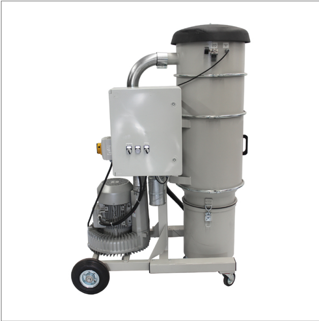
CE-MOB - Mobile suction unit