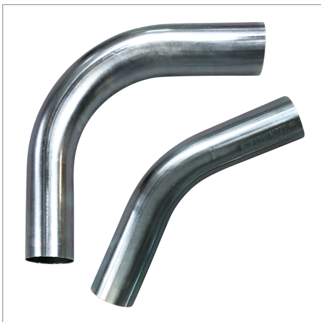
STBE - Steel bend galvanized