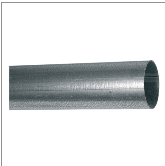
STPI - Steel pipe sendzimir galvanized

Rura stalowa, sendzimir galwanizowana. Rury są dostępne w innych grubościach i wykończeniu powierzchni, prosimy o kontakt.