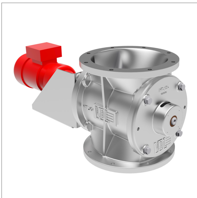
HT - rotary valve for low negative under pressures, <5000 pa

HT posiada 6-topatkowy wirnik. HT-S posiada 8-topatkowy wirnik.